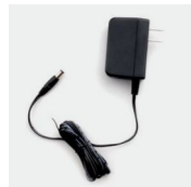
Адаптер питания PS1026