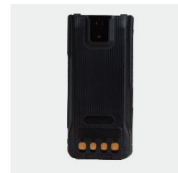
Литий-ионный аккумулятор BL1815-EX