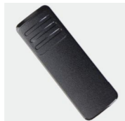
Зажим для крепления к поясному ремню BC39